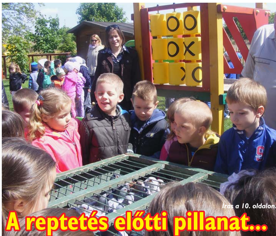
Írás a 10. oldalon.