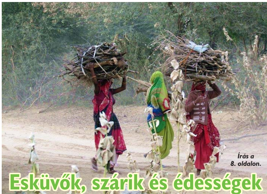
Írás a 8. oldalon.