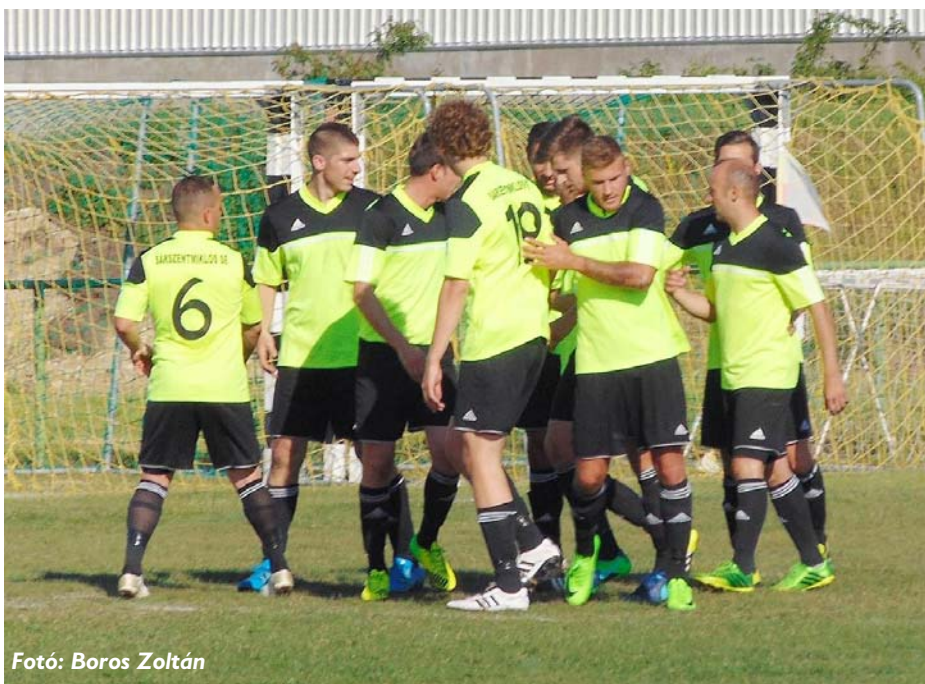
Fotó: Boros Zoltán