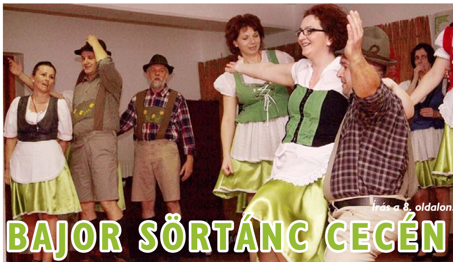
Írás a 8. oldalon.