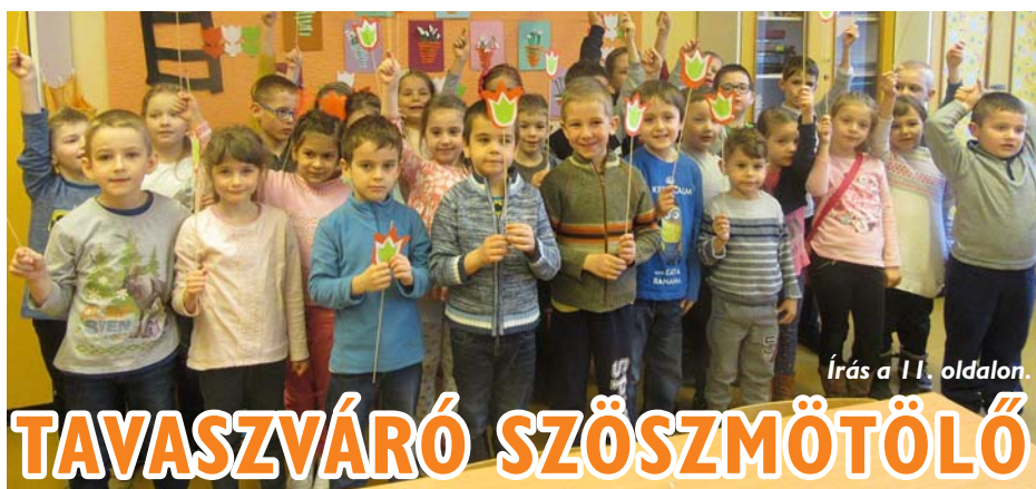
Írás a 11. oldalon.