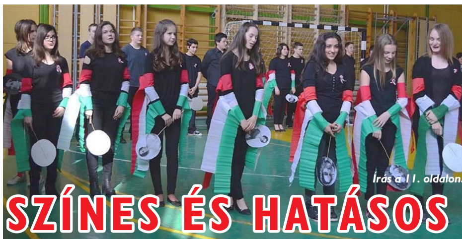
Írás a 11. oldalon.