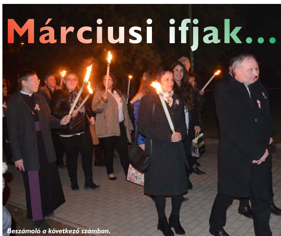
Beszámoló a következő számban.