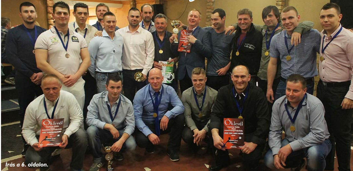
Írás a 6. oldalon.