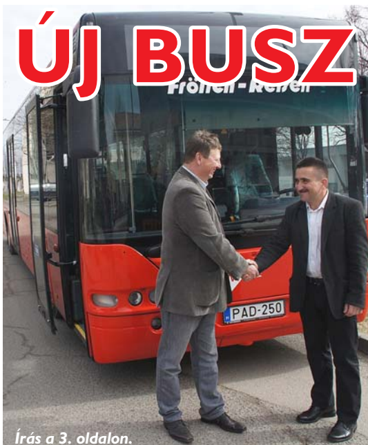
Írás a 3. oldalon.