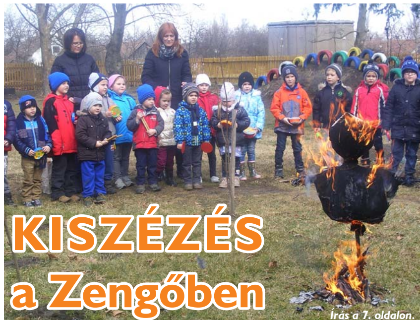
Írás a 7. oldalon.