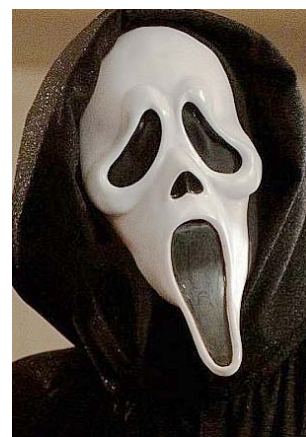
A Sikoly című film

Egy életrevaló üzlettulajdonos egyébként egyből meghirdette, hogy akciósan kapható nála a Sikoly-álarc. Bár nem tudom, ezek után ki mer magára öltetni ilyen jelmezt például a Zengő óvoda Halloween-partijára... hacsak nem akar természetes úton, ingyen plasztikáztatni.