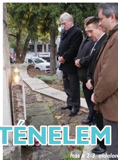
Írás a 2-3. oldalon.