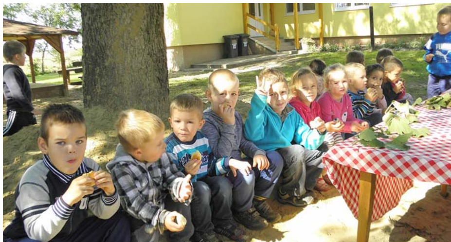
Szüret a cecei határban