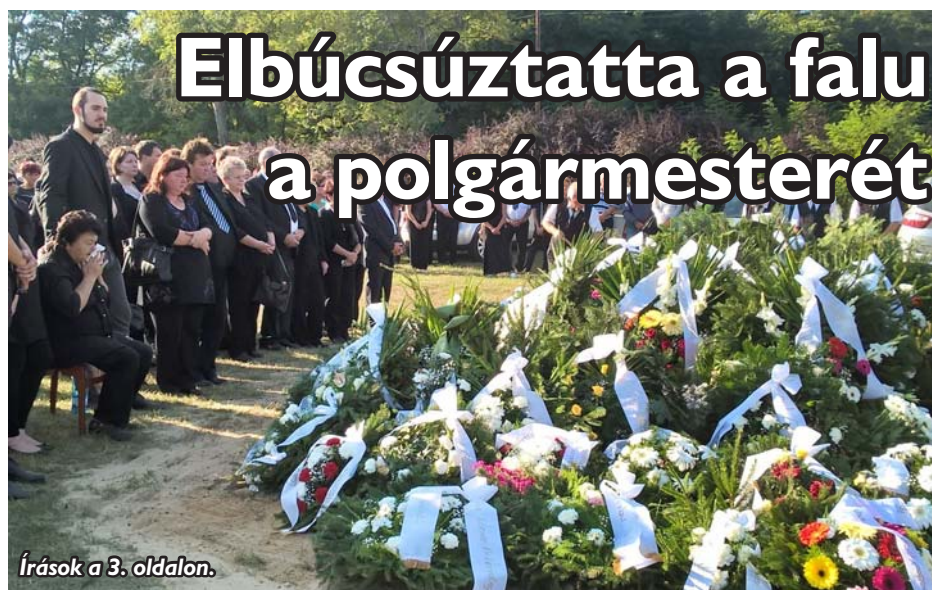
Írások a 3. oldalon.