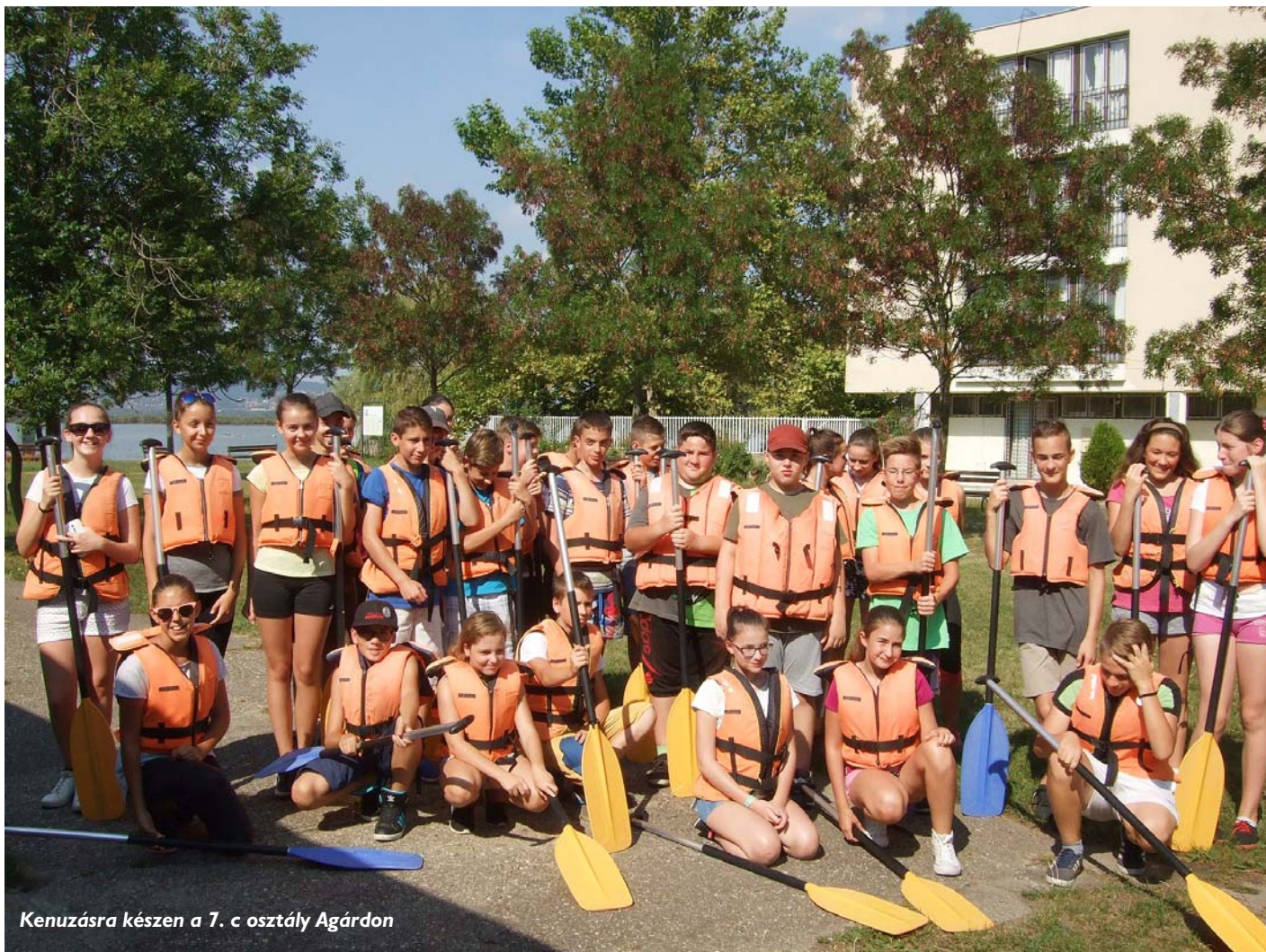
Kenuzásra készen a 7. c osztály Agárdon

A gimnazisták őszi kirándulásairól készült fotókat heti részletekben közöljük.