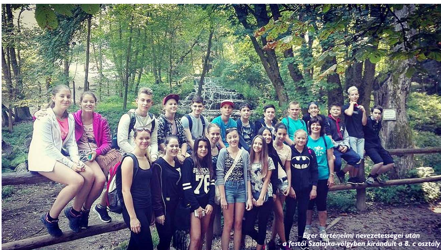
Eger történelmi nevezetességei után a festői Szalajka-völgyben kirándult a 8. c osztály

A gimnazisták őszi kirándulásairól készült fotókat heti részletekben közöljük.