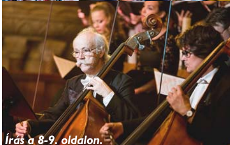
Írás a 8-9. oldalon.