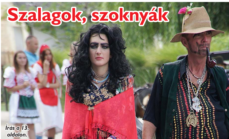
Írás a 13. oldalon.