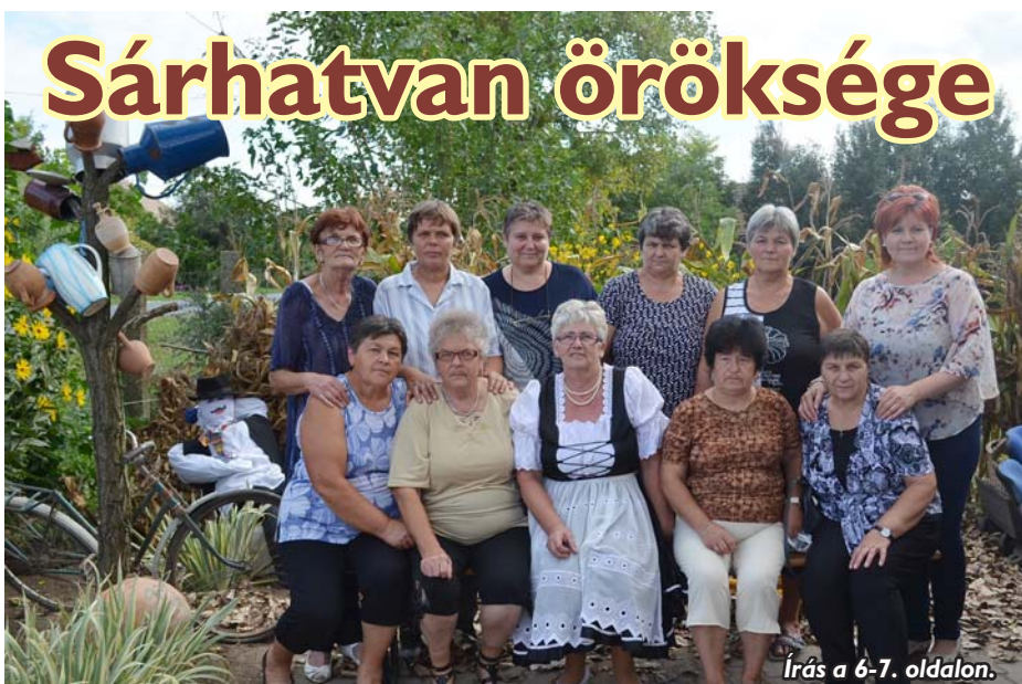
Írás a 6-7. oldalon.