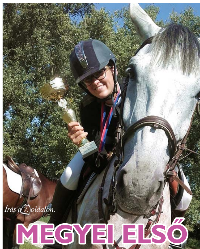
Írás a 7. oldalon.