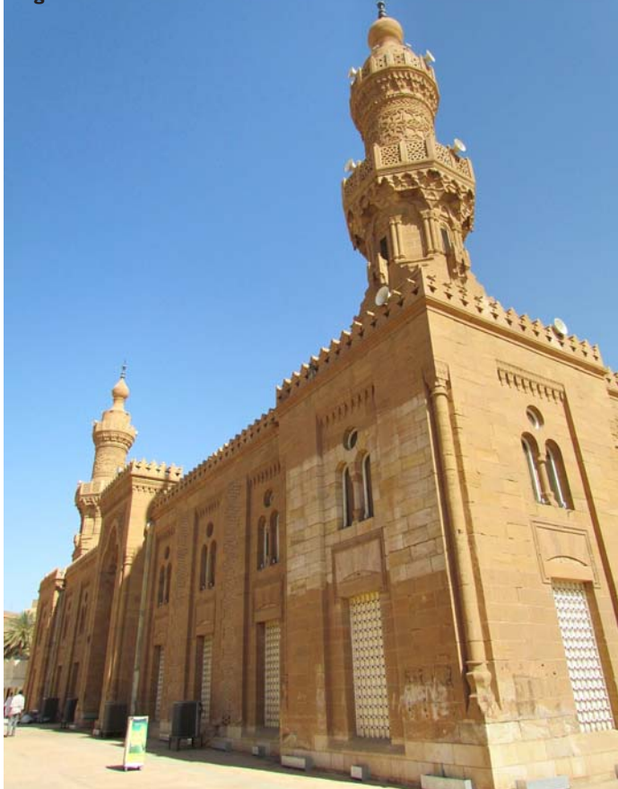
Régi oszmán-török mecset