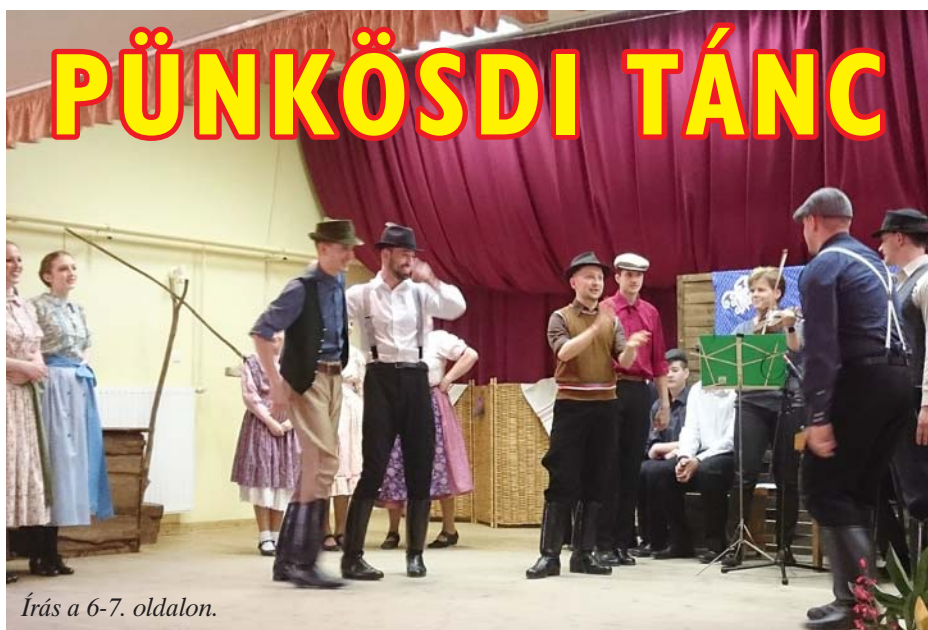
Írás a 6-7. oldalon.