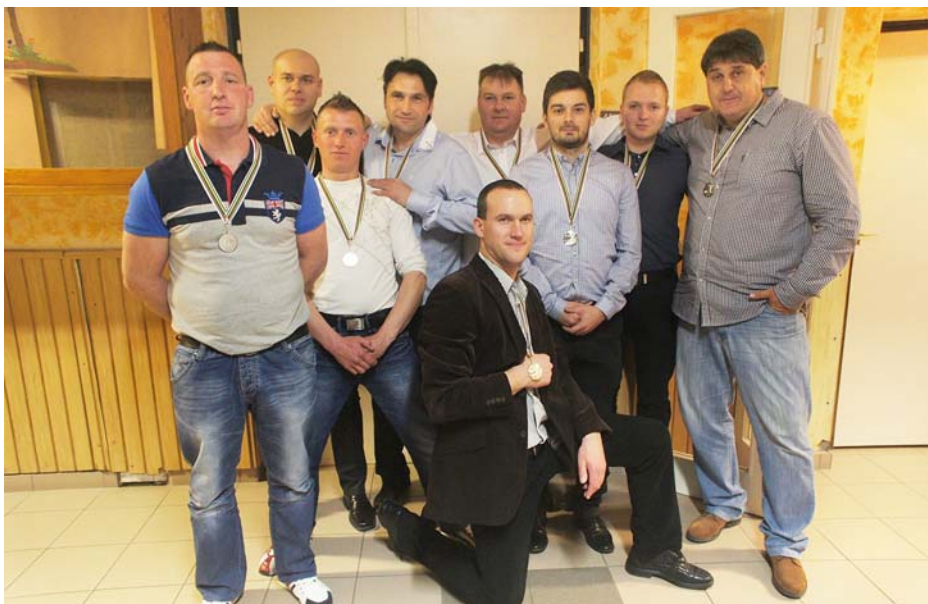
TWISTER GALAXY II. helyezett