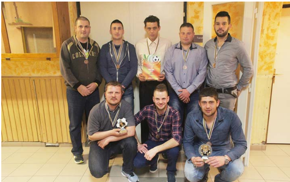
FDL Kft. III. helyezett