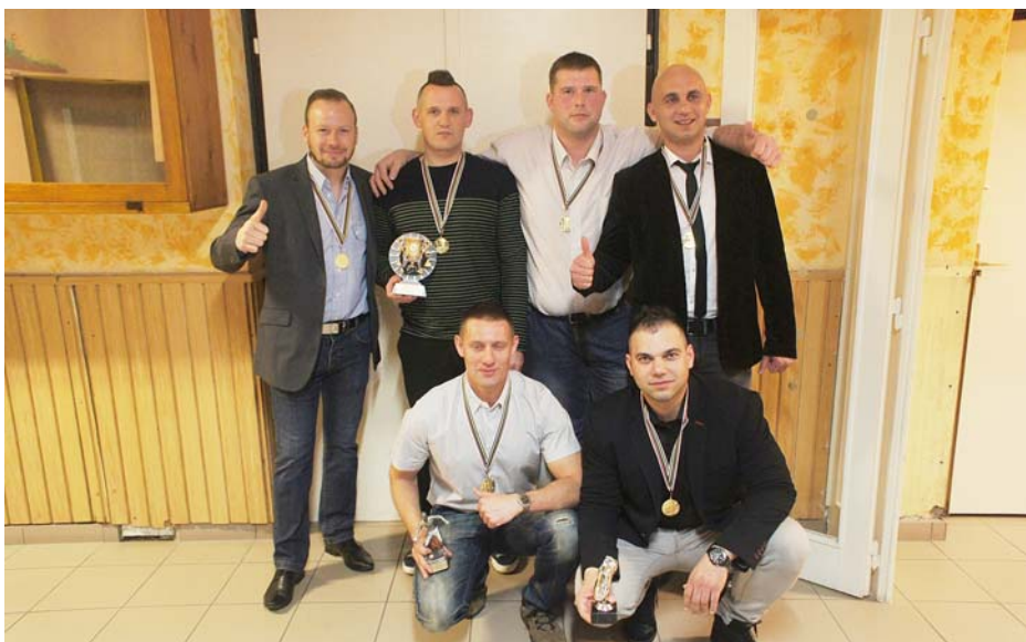
EXTRÉM I. helyezett