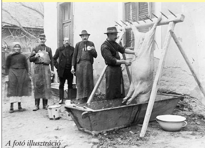
A fotó illusztráció