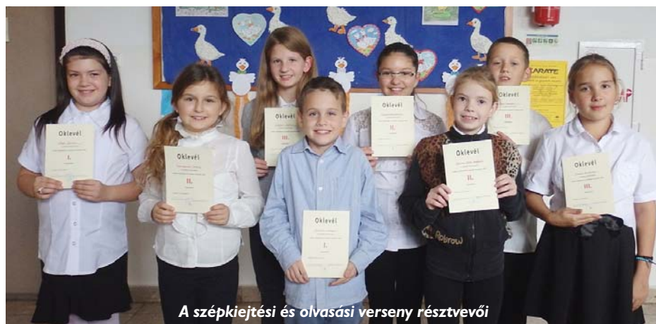
A szépkiejtési és olvasási verseny résztvevői