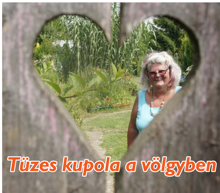
Tüzes kupola a völgyben