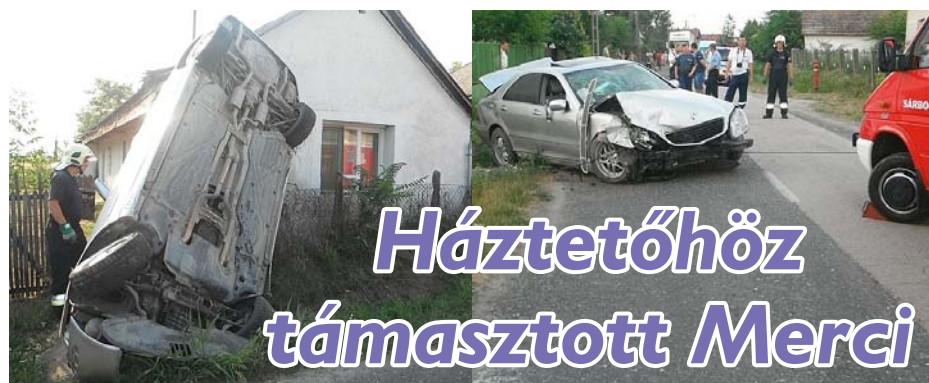
Háztetőhöz támasztott Mercit