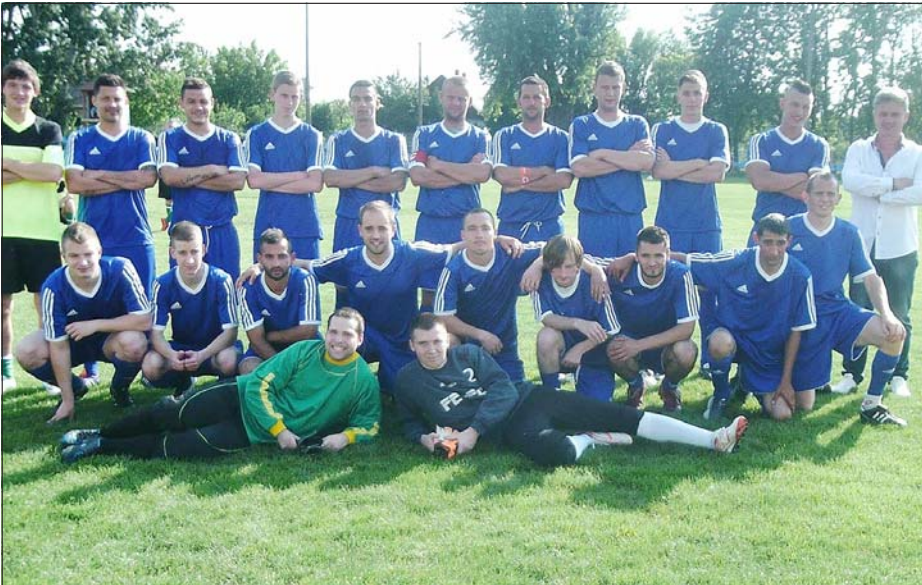
Sárszentmiklósi SE II. megye III. osztály bajnokcsapat