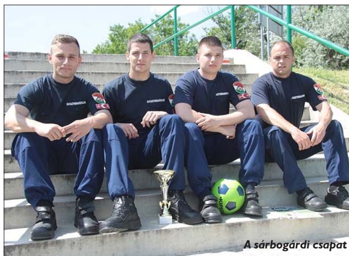
A sárbogárdi csapat