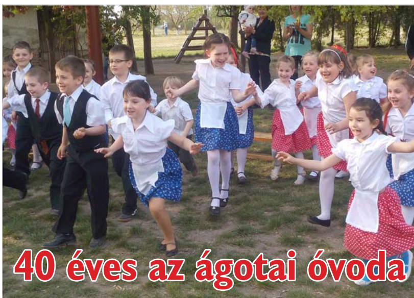
40 éves az ágotai óvoda