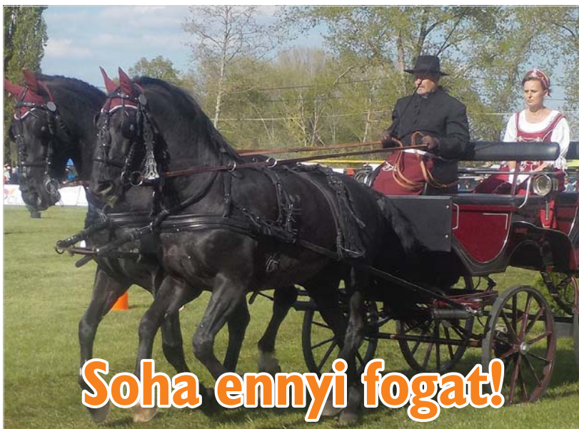
Soha ennyi fogat!