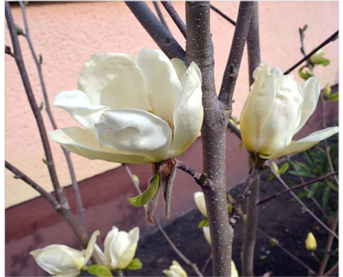
Papp Béla és felesége háza előtt cseperedik ez a különleges tulipánfa, aminek virágzását megörökítettük.