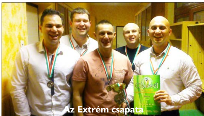
Az Extrém csapata

A díjátadó ünnepség után feltálatták a finom vacsorát, majd annak elfogyasztását követően hajnalig tartó mulatság vette kezdetét. Az esthez és a tánchoz a zenét Rigó Gábor szolgáltatta.