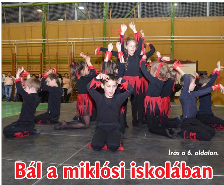
Írás a 6. oldalon.