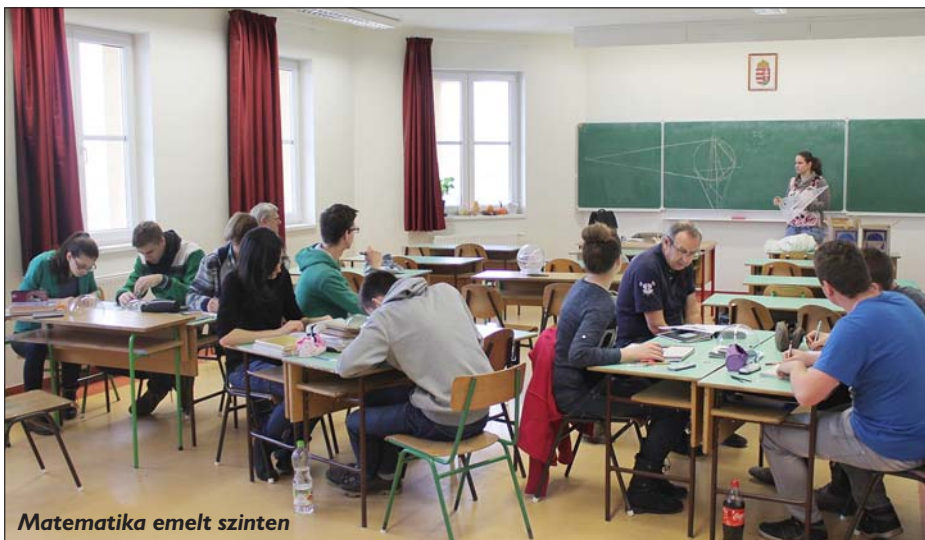
Matematika emelt szinten