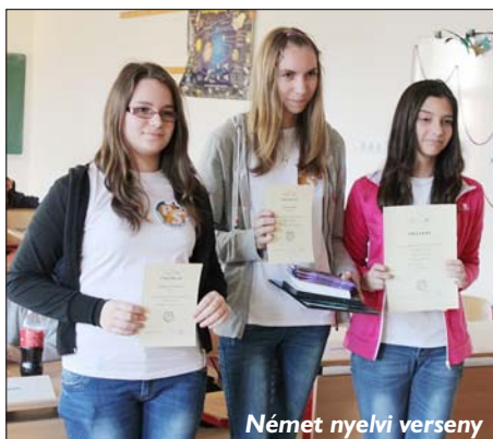
Német nyelvi verseny