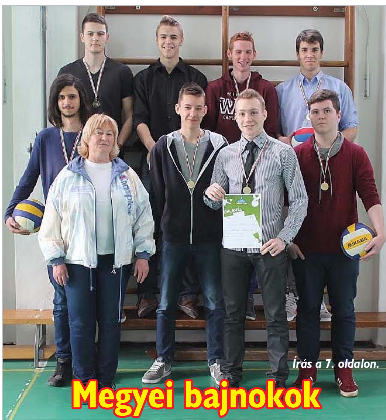
Írás a 7. oldalon.