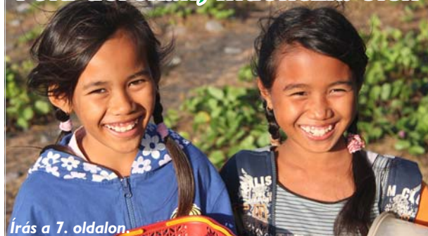
Írás a 7. oldalon.