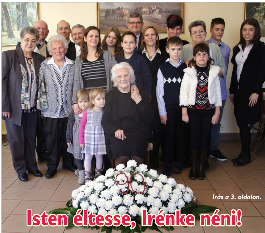
Isten éltesse, Irénke néni! Írás a 3. oldalon.