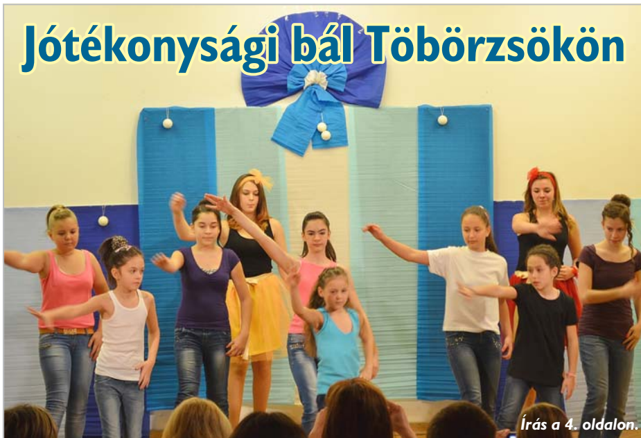
Írás a 4. oldalon.