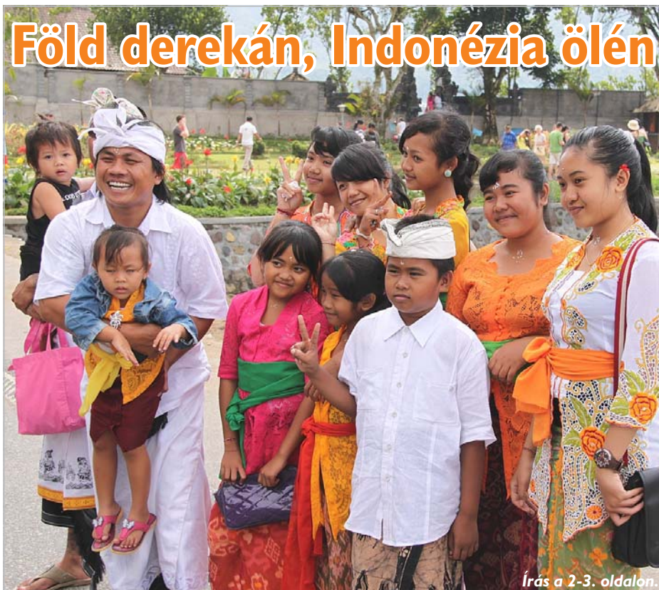
Írás a 2-3. oldalon.