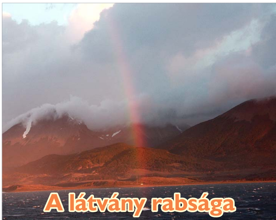
A látvány rabsága