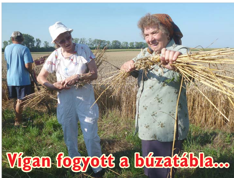
Vígan fogyott a búzatábla...