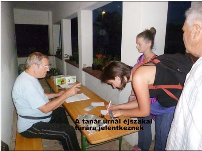
A tanár úrnál éjszakai túrára jelentkeznek

Az a különleges vonzás – mellyel Nagylók rendelkezik a környező falvakkal körülvevő gyönyörű természeti szépségei révén – újra és újra idecsábítja a sportszerűen túrázókat, híre vonzza az újabb résztvevőket. Ezzel együtt a természet és az ember kedves találkozása adja a túra érzelmi értékét.