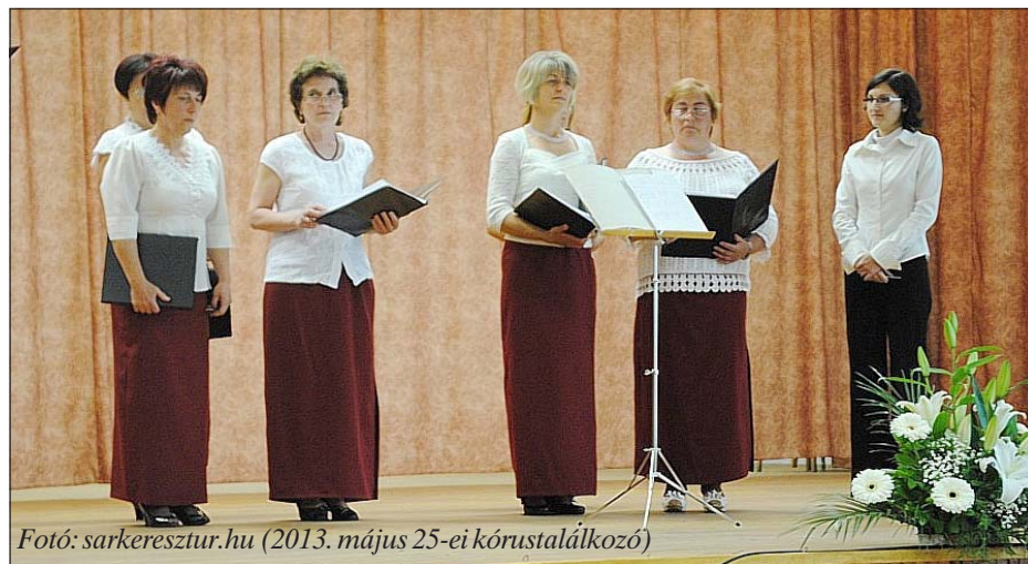
(2013. május 25-ei kórustalálkozó)

A jubileumi ünnepség színvonalát emelte a Paksi Római Katolikus Kórus műsora Csergő Vilmosné Farkasfalvy Ágnes vezetésével és Király István hangszerkísérettel. A 25 éves múltra visszatekintő, nagy