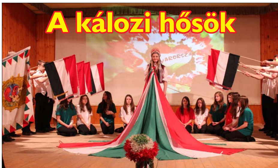
A kálozi hősök