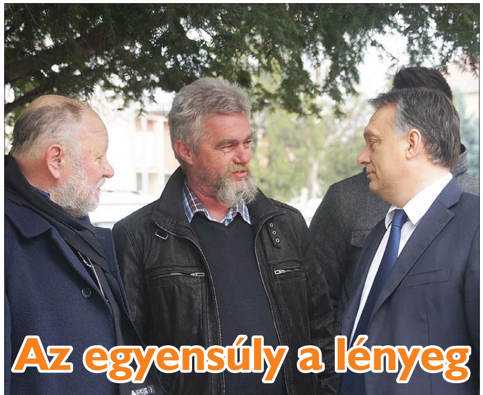
Az egyensúly a lényeg