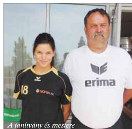
A tanítvány és mestere

Németh László Általános Iskola, Mezőszilas