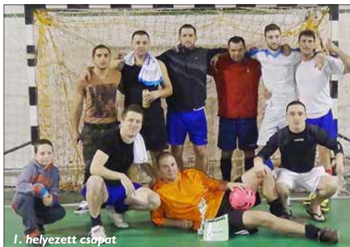
I. helyezett csapat