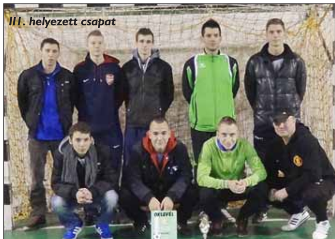
III. helyezett csapat