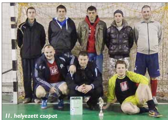
II. helyezett csapat