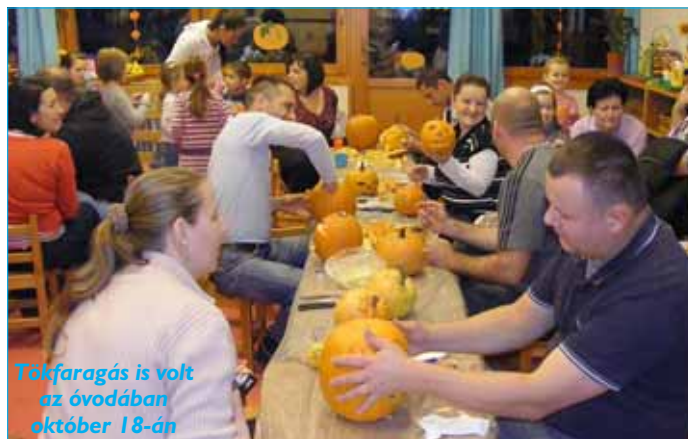
Tokfaragás is volt az óvodában október 18-án