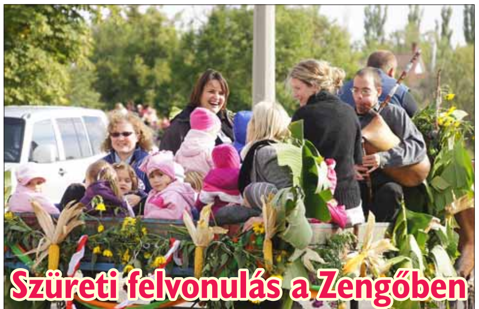
Szüreti felvonulás a Zengőben