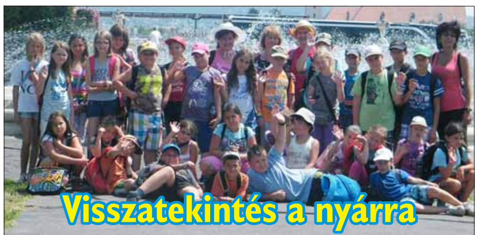
Visszatekintés a nyárra