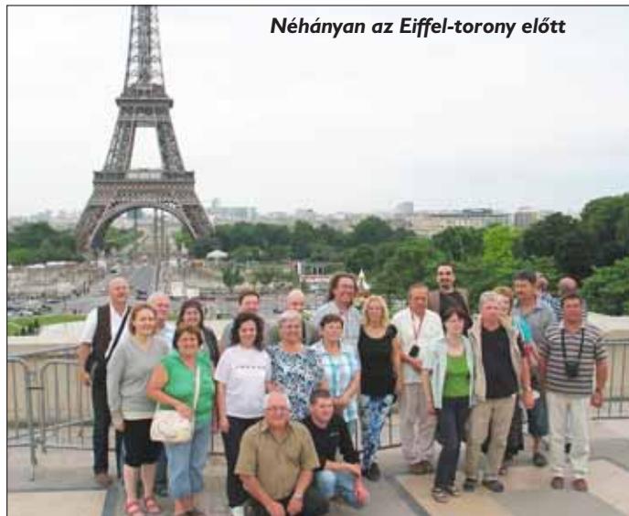
Néhányan az Eiffel-torony előtt

9-10. nap A hazaúton a schaffhauseni Rajna-vízesés nyűgözte le csoportunkat. A Niagara csak kistestvére lehetne, de ez is lélegzetelállító volt! Majd Salzburghban, Mozart szülővárosában sétáltunk meg elgémberedett tagjainkat.