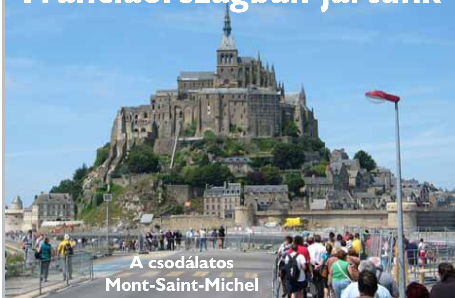
A csodálatos Mont-Saint-Michel