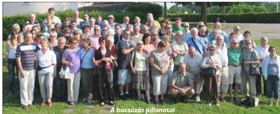
A búcsúzás pillanatai

mindössze egy út köt össze a kontinenssel, mivel egy szigeten található, és az óceán dagálykor rendre körbefolyja, régen el is vágta a szárazföldtől.