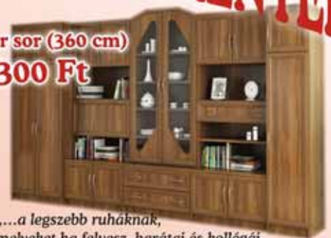
Senator sor (360 cm) 123.300 Ft

„...melyben a házi mozi hangfal szettje elhelyezve olyan akusztikus térhatást ad vissza nappalijába, mintha egy Cinema moziban ülne”