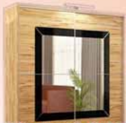
Miami gardrób (200 cm) 105.900 Ft

„...a legszebb ruháknak, melyeket ha felvesz, barátai és kollégái megpukkadnak a sárga irigységtől...”