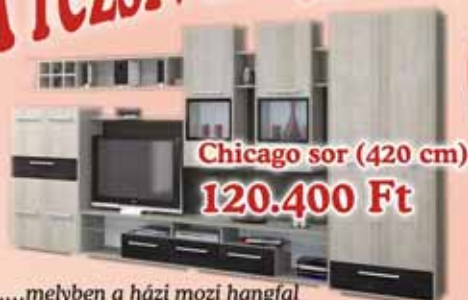
Chicago sor (420 cm) 120.400 Ft

„...melyben a házi mozi hangfal szettje elhelyezve olyan akusztikus térhatást ad vissza nappalijába, mintha egy Cinema moziban ülne”