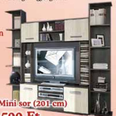
Big Mini sor (201 cm) 56.500 Ft

Extra bónuszként pedig, hogy ne csak az első pár hétben büszkélkedhessen új szekrényével, hanem hogy az idők végezetéig megőrizze ragyogását, egy exkluzív tisztító szettel is meglepjük Önt. AJÁNDÉKBA.