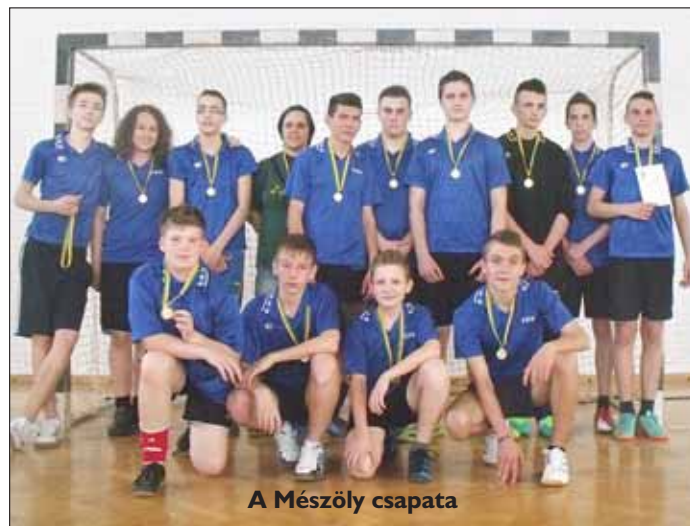
A Mészöly csapata

Sárbogárdról három csapat is indult a megmérettetésen: a Mészöly Géza Általános Iskola fiú- és a Petőfi Sándor Gimnázium lány-, illetve fiúcsapata. Az iskolák sportolói és nevelői együtt utaztak a versenyre, a buszon a vidám hangulatban gyorsan elrepült az idő.