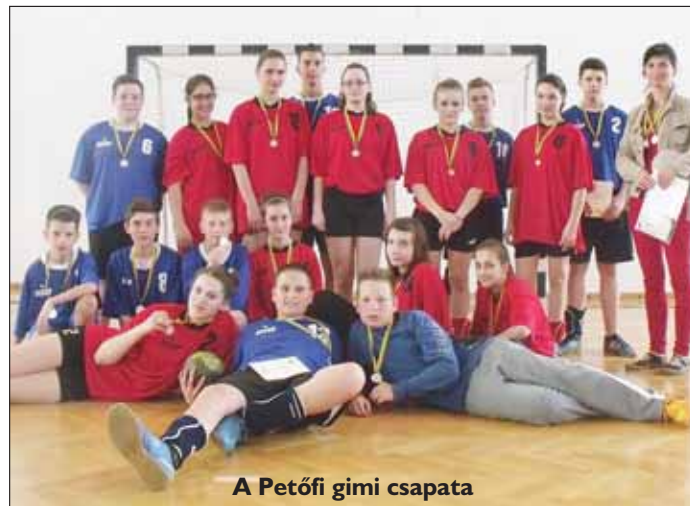
A Petőfi gimi csapata

Először a lányok játszottak, de sajnos elvesztették a meccset, majd következtek a mészölyös fiúk, akik viszont simán megnyerték a mérkőzést. A lányok a második meccsüket megnyerték, így a harmadik helyen végeztek. Egy meccsnyi pihenő után jöttek a gimis fiúk, akik szintén győztek.