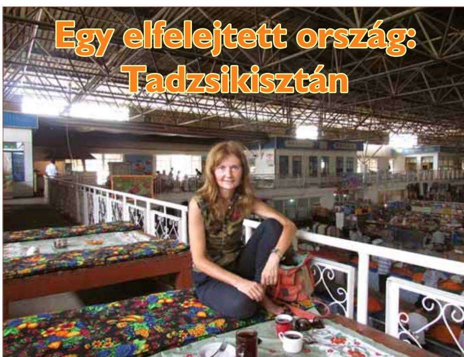
Egy elfelejtett ország: Tadzsikisztán