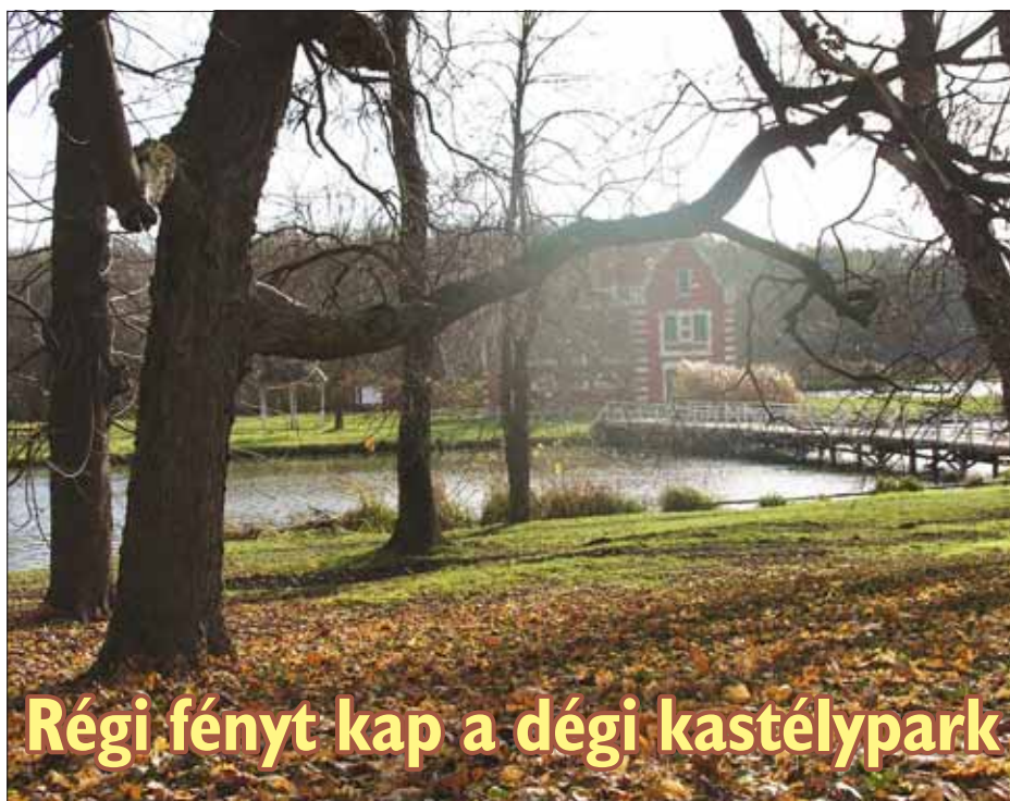
Régi fényt kap a dégi kastélypark