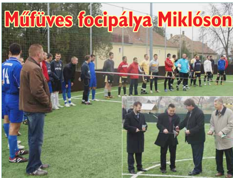
Műfüves focipálya Miklóson