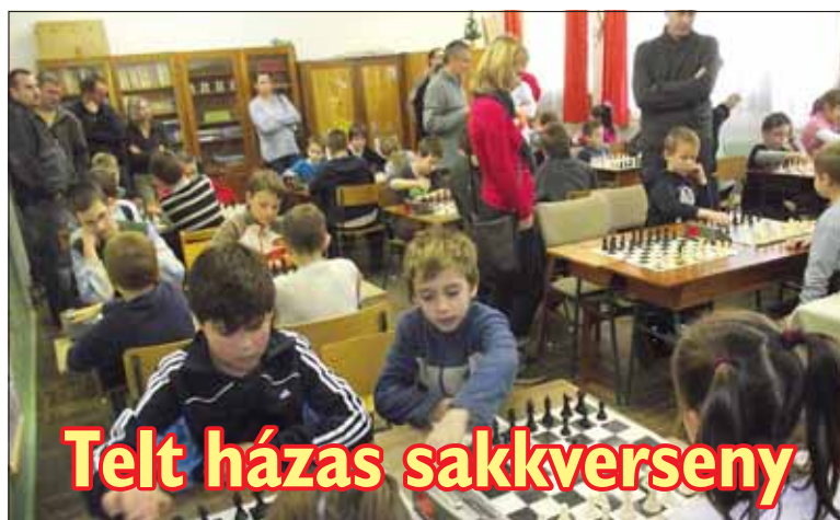
Telt házas sakkverseny