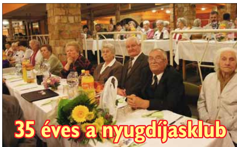
35 éves a nyugdíjasklub