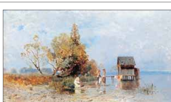
Mészöly Géza: Balatoni fürdőház (1875)

A család a Somogy vármegyei Mysel nemzetségből származik. Egy 1408. évi irat ezen nemzetség több tagját Somogy megyében nemes birtokosként említi. A 16. században már Mészely és később Mészöl, majd később Mészely és Mészöly névalakok jönnek az iratokban közhasználatba. A család később számos ágra szakadt. Az egyik legismertebb ág a sárbogárdi familia lett, akiknek nyomait a 18. századi elejéig vezethetjük vissza településünkön. Számos neves személyiség tartozott ide, többek között a festőművész Mészöly Géza, a nyelvész Mészöly Gedeon, vagy az irodalmár Mészöly Dezső.