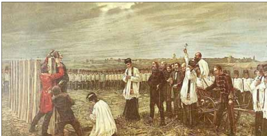
Thorma János: Aradi vértanúk kivégzése