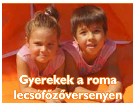
Gyerekek a roma lecsófőzőversenyen