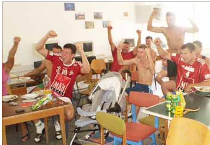
Szurkolás a magyar-izland meccs alatt

A viccet félretéve, csapatunk egy emberként szurkolt a televízió előtt magyar olimpikonjainknak. Az esti közvetítéseket projektoron át kivettük sorra a kézilabda-, vízilabda-mérkőzéseket, összefoglalókat.