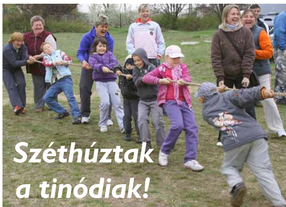
Széthúztak a tinódiak!

No, persze, csak úgy képletesen értve, mert nagyon is összetartó, családi közösséget alkot ez a városrész. Az elmúlt szombaton azonban kötélhúzást rendeztek a vasút melletti focipályán. Mindenki mindenkivel összemérte az erejét.