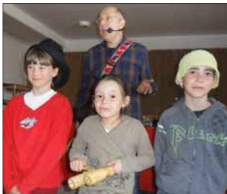
Figura Ede már sokadik alkalommal látogatott el Cecére, ahol mindig nagy szeretettel fogadják a gyermekek és felnőttek

egyaránt. A tavaszi szünet előtti utolsó napon két előadást is tartott a kicsiknek.