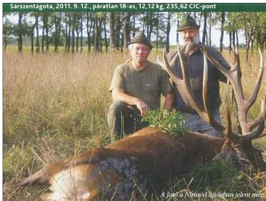
A fotó a Nimród újságban jelent meg.

Az őseink által belakott Kárpát-medencét a néhány számon tartott utazó megismerte. Természeti értékeit nagyra becsülték. Ismert, hogy a vadászati jog akkor is a földtulajdonost illette, ahogy ma is, a szokásjog, valamint a törvények értelmében.