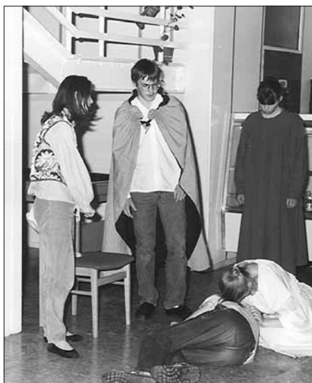
Az irodalmi színpad Rómeó és Júlia előadása (1990)

A négyosztályos gimnáziumi oktatás mellett az 1988-89-es tanévtől újra beindult a szakközépiskolai képzés. 1993-ban pedig megkezdődött a tanítás a nyolcosztályos gimnázium első osztályában, majd 2005-ben az első nyelvi előkészítő osztályban.