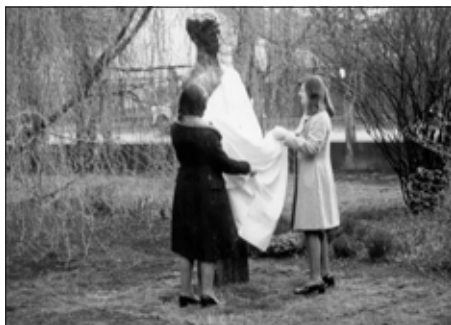
A névadónk szobrának leleplezése (1975)

Kialakultak az iskolai ünnepélyek megrendezésének hagyományai.