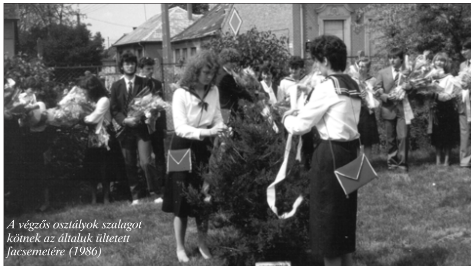
A végzős osztályok szalagot kötnek az általuk ültetett facsemetére (1986)

Újra öt tárgyból kellett érettségizni, kötelező lett az érettségi történelemből és egy idegen nyelvből is. Az egyetemi-főiskolai felvételibé hat tárgy jegyei számítottak. II. osztályban féléves kurzus foglalkozott a pályaválasztás lehetőségeivel, a helyes önismeret elsajátításával. Osztályfőnöki órákon nagyobb hangsúlyt kapott a családi életre nevelés.