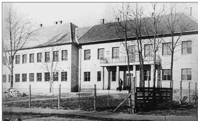
Az iskola épülete ekkor csak két részből áll, a jobb oldali szárny még hiányzott (1953)

Nagy gondot fordítottak a helyesírás oktatására, a helyes tanulási módszerek kialakítására. Szakköröket indítottak. Tanulópárokat szerveztek, és korrepetálásokat indítottak az arra rászorulóknak. Szeptemberben megalakult az első önálló iskolai DISZ-szervezet, amely szorosan együttműködött a községivel. Kapcsolatot létesítettek szovjetunióbeli Komszomol csoportokkal. Fáklyás felvonulást tartottak május 1-je tiszteletére. Fém- és tojásbegyűjtő akciókban, facsemete-ültetésben, gyapotszedésben, könyvnap