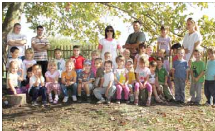
A Zengő Óvoda Szivárvány csoportjának apukái egy saját készítésű, ügyességfejlesztő udvari játékkal lepték meg a gyermekeket.

A feloivasás után kötetlen beszélgetés a könyv jövőjéről vagy eltűnéséről... ...de valóban eltűnik a könyv?