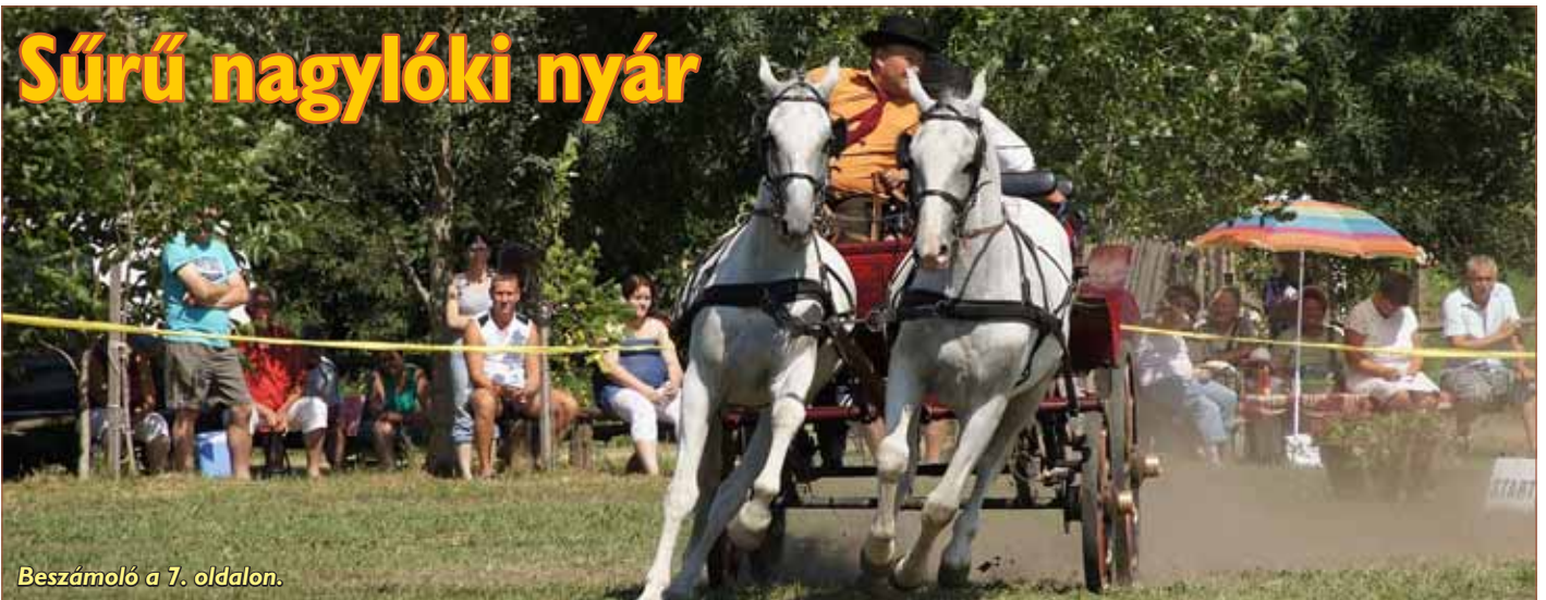
Beszámoló a 7. oldalon.