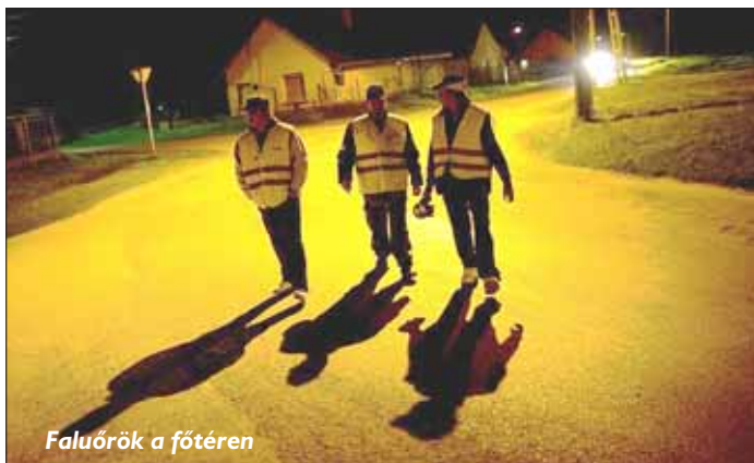
Faluőrök a főtéren

Tucatnyi roma férfi gyülekezik szerdán kora délután a sárkeresztúri önkormányzat tanácstermében. Türelmetlenek, alig bírják végigülni a polgármester tájékoztatóját, közbeszólnak, javaslatokat tesznek, párokba rendeződnek. A segélyfeltételeként szabott közmunka miatt rendelték be őket a hivatalba, de most többről van szó, mint egyszerű fűnyírásról, utcaseprésről. Borzongató feladatot kapnak: éjszakánként kettesével járják az utcákat, a falura kell vigyázniuk.