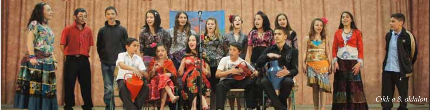
Cikk a 8. oldalon.