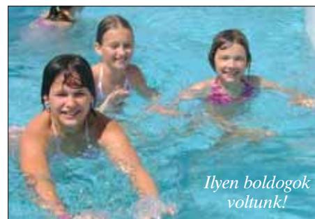
Ilyen boldogok voltunk!

Utolsó nap a Sobri Jóska kalandparkban voltunk Kislődön. Lézerharcozhattunk, tutajoz-