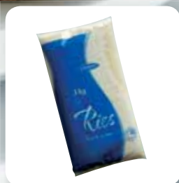
Complex kerek szemű rizs, 1kg

Most csütörtökön minden vásárlónknak, aki 5000 Ft felett vásárol, egy finom és gyors vacsora hozzávalóit, 1 kg rizst és 1 kg gyorsfagyasztott pulykafasírtot ajándékba adunk! Jó étvágyat kívánunk!