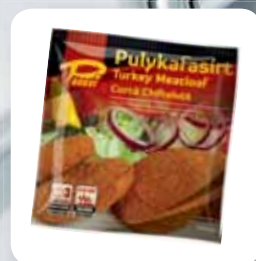
Pancsi panírozott gyorsfagyasztott pulykafasírt, 1kg

MÁJUS 13-ÁN, MÁJUS 20-ÁN, MÁJUS 27-ÉN ÉS JÚNIUS 3-ÁN