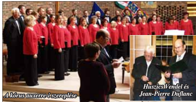
A kórus auxerre-i szereplése